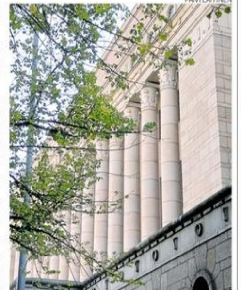
Sonkajärveläiset pääsevät tutustumaan eduskuntata-loon ja oman seudun kansanedustajiin.

Sonkajärveläisten reissu on 7.–9. toukokuuta, lisätietoja löytyy ja ilmoittautua voi 5.4. mennessä Henkilökuljetus Rissaselle mieluiten verkko-